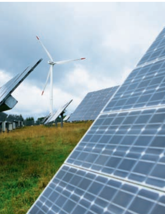
Die Anlage auf dem Mont-Soleil wird 20.

Draussen brechen die Wolken auf; die LED-Anzeige am Kraftwerkshäuschen zeigt die Erhöhung der Stromproduktion an. Die Schafe verschwinden hinter einem Solarpanel. Die Aussichten sind sonnig.