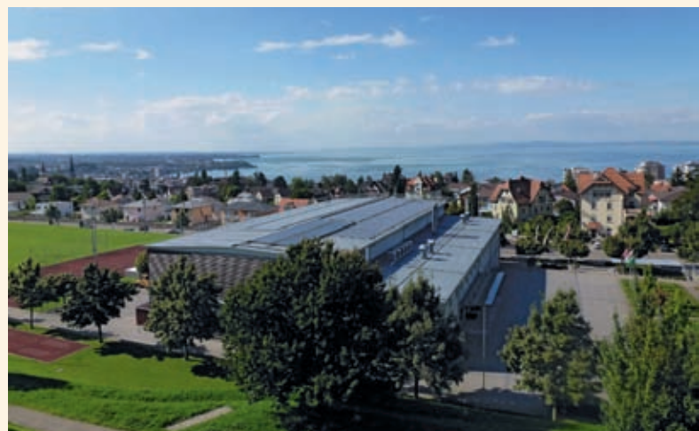
Auch ein Kraftwerk: die Mehrzweckhalle in Rorschacherberg.

> Die Anlage mit einer Leistung von 110 Kilowatt soll jährlich rund 100 000 Kilowattstunden produzieren. Einen Teil bezieht die Gemeinde für sich. Der Rest wird als zertifizierter Ökostrom «1to1 energy sun star» vertrieben.