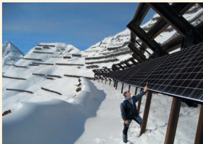
Bald real: Solarkraftwerk in den Alpen (Fotomontage).

Schweiz. Die Alpen mit ihrer hohen Sonneneinstrahlung, der Reflexionskraft des Schnees und den tiefen Temperaturen sind für hohe solare Stromerträge ideal. Laut einer Studie könnten Lawinenverbauungen in der Schweiz Strom für mehr als 50 000 Haushalte liefern. Das geplante Kraftwerk auf dem Chüenihorn soll über 1 200 Haushalte mit Strom versorgen – und jedes Jahr werden rund 2 500 Tonnen CO 2 eingespart.