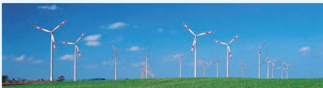
Neuer Eigentümer: Windpark Lüdersdorf-Parstein.

➤ Der Windpark im Bundesland Brandenburg, im Nordosten von Deutschland, ist seit Ende 2004 am Netz. Er weist eine installierte Leistung von 22,5 MW auf und produziert mit insgesamt 15 Turbinen rund 53 GWh CO 2 -freien Strom. Dies ent-